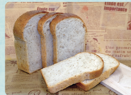
ほしの酵母食パン

天然酵母パン&焼き菓子の店Popoloとして建物の一角に小さな店をかまえています。お気軽にお立ち寄り下さい。