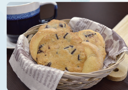
チョコチャンククッキー