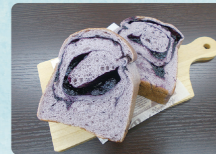
ブルーベリー食パン